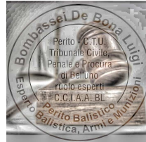
Perito Balistico - Studio Balistica Forense Perizie e Consulenze Tribunali Italiani